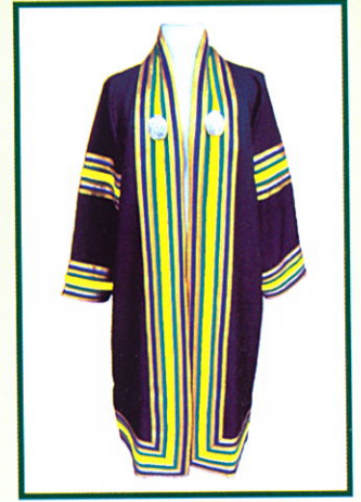
วิทยาศาสตร์บัณฑิต (วท.บ.) แถบครุยสีเหลือง