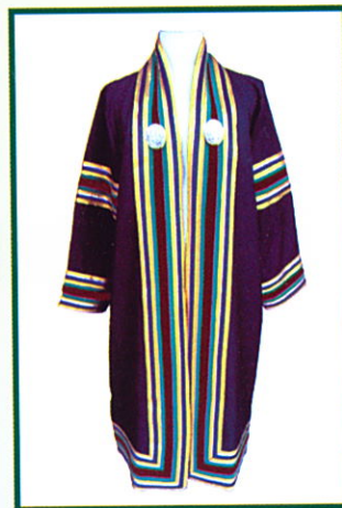
รัฐประศาสนศาสตรบัณฑิต (รป.บ.) แถบครุยสีน้ำตาล