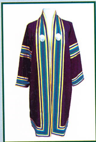
นิเทศศาสตรบัณฑิต (นศ.บ.) แถบครุยสีกรมท่า