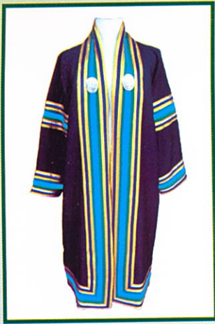
ครุศาสตรบัณฑิต (ค.บ.) แถบครุยสีฟ้า