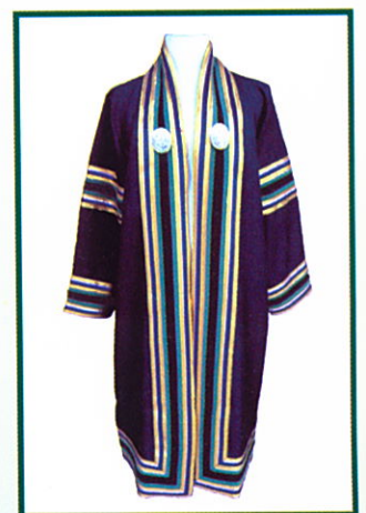
รัฐศาสตรบัณฑิต (ร.บ.) แถบครุยสีดำ

หมายเหตุ ปริญญาสาขาเดียวกันในแต่ละระดับ (ตรี โท เอก) ใช้แถบครุยสีเดียวกันแต่เพิ่มจำนวนแถบ