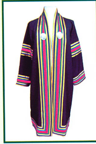
บริหารธุรกิจบัณฑิต (บธ.บ.) แถบครุยสีชมพู