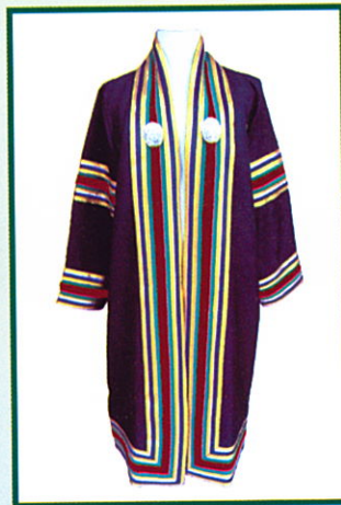
วิศวกรรมศาสตรบัณฑิต (วศ.บ.) แถบครุยสีแดงเลือดหมู