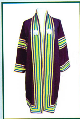
เทคโนโลยีบัณฑิต (ทล.บ.) แถบครุยสีเขียวตองอ่อน