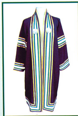
นิติศาสตรบัณฑิต (น.บ.) แถบครุยสีขาว