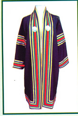
ศิลปศาสตรบัณฑิต (ศศ.บ.) แถบครุยสีแดง