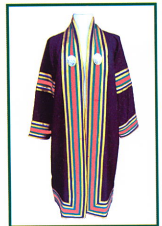
สาธารณสุขศาสตรบัณฑิต (ส.บ.) แถบครุยสีชมพูอมส้ม