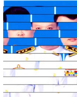
นายฉลอง รุ่งศิริ นักวิชาการศึกษา