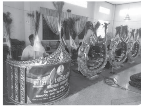
ภาพที่ 4 วงดนตรีไทยของกลุ่มวัฒนธรรมไทย

4) กลุ่มวัฒนธรรมไทย จากการศึกษาของกลุ่มวัฒนธรรมไทยในพนมสาคามพบว่า เป็นกลุ่มที่ยังคงยึดวิถีวัฒนธรรมประเพณีของตนเอง ซึ่งประเพณีที่พบ คือ ประเพณีทำขวัญข้าวเลี้ยงแม่โพสพ ตั้งห้อง ประเพณีสงกรานต์ ประเพณีสารทไทย ประเพณีลอยกระทง ประเพณีวันขึ้นปีใหม่ ประเพณีเข้าพรรษา โดยกลุ่มวัฒนธรรมไทยมีการดำเนินชีวิตที่เอื้อเฟื้อเผื่อแผ่ให้กับคนในกลุ่มวัฒนธรรมอื่นๆ โดยไม่มีการแบ่งแยกว่าใครเป็นกลุ่มวัฒนธรรมใด นอกจากนี้กลุ่มวัฒนธรรมไทยยังคงมีการนำเอาดนตรีโดยเฉพาะวงปี่พาทย์ ไม่ว่าจะปี่พาทย์มอญหรือวงปี่พาทย์ไม้แข็งเข้าไปบรรเลงประกอบในพิธีต่าง ๆ