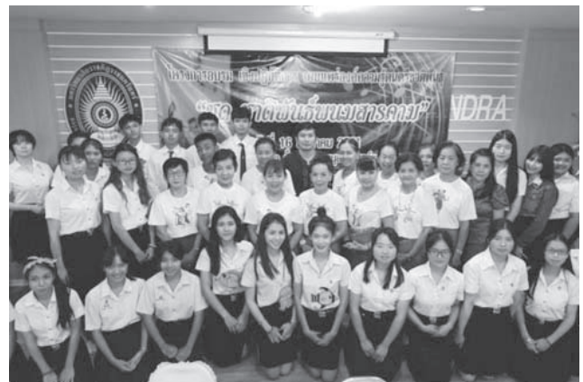
ภาพที่ 5 ผู้เข้าร่วมกิจกรรมโครงการอบรมเชิงปฏิบัติการเผยแพร่ความรู้ดนตรีชาติพันธุ์ชุด "ชาติพันธุ์พจนานุกรม"

ต่อยอดเพื่อเป็นเพลงที่ใช้บรรเลงในเทศกาลต่าง ๆ และควรนำไปสร้างสรรค์ร่วมกับการการแสดงนาฏศิลป์ร่วมสมัยที่สื่อถึงวัฒนธรรม ประเพณีของกลุ่มวัฒนธรรมต่าง ๆ ในพจนานุกรมต่อไป