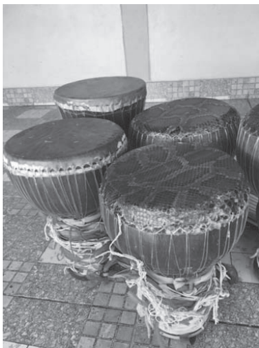
ภาพที่ 3 กลองโทน เครื่องดนตรีของกลุ่มวัฒนธรรมเขมร

3) กลุ่มวัฒนธรรมเขมร เป็นกลุ่มวัฒนธรรมที่พบอยู่ที่หมู่บ้านดงน้อย โดยกลุ่มวัฒนธรรมเขมรในหมู่บ้านนี้ยังคงรูปแบบการดำเนินชีวิต วิถีวัฒนธรรม ประเพณีของตนเองอย่างเคร่งครัด โดยประเพณี พิธีกรรมที่ปรากฏ คือ ประเพณีการแห่ข้าวบิณฑ์หรือการแห่ตายาย ประเพณีการเลี้ยงผีและการประทับทรง ซึ่งประเพณีที่ปรากฏมีการสืบทอดมาอย่างยาวนานและปัจจุบันยังคงปฏิบัติกันอยู่เป็นประจำทุกปี เป็นพิธีกรรมความเชื่อเรื่องการบูชาผี นับถือผี ซึ่งมีความเชื่อว่าเมื่อทำแล้วจะทำให้ชีวิตมีความสุข ผู้ใดป่วยเมื่อรักษาด้วยหมอผีแล้วจะหายจากอาการป่วย ดนตรีที่นำมาประกอบพิธีกรรมของชาวเขมร คือ วงหัวไม้ผสมซอเขมร โดยวงขับไม้ประกอบด้วยเครื่องดนตรีคือกลองโทน ซึ่งตั้งแต่สมัยโบราณมีเพียงกลองโทนเท่านั้น แต่ในปัจจุบันมีการนำซอเขมรเข้ามาสีประกอบเพื่อให้มีท่วงทำนองที่สนุกสนานมากขึ้น